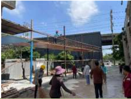
รูปที่ 12 พนักงานทำความสะอาดโครงการ