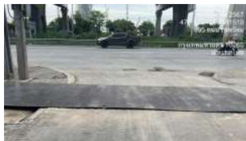
รูปที่ 9 แผ่นเหล็กและพื้นคอนกรีต