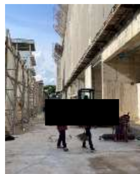
รูปที่ 12 พนักงานทำความสะอาดโครงการ