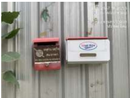
รูปที่ 6 กล้องรับความคิดเห็น