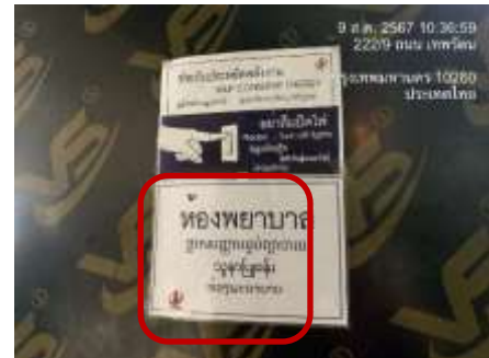
รูปที่ 27 ห้องพยาบาล