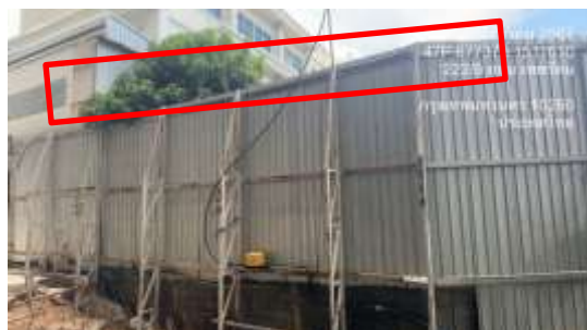
รูปที่ 11 ติดตั้งสเปรย์รอบโครงการ