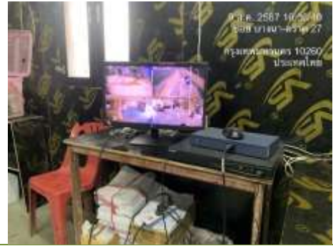
รูปที่ 25 ห้องควบคุมกล้องวงจรปิด