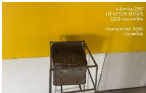
รูปที่ 29 พื้นที่สูบบุหรี่