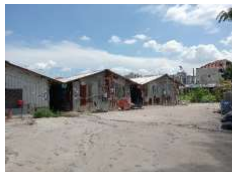
รูปที่ 23 บ้านพักคนงาน