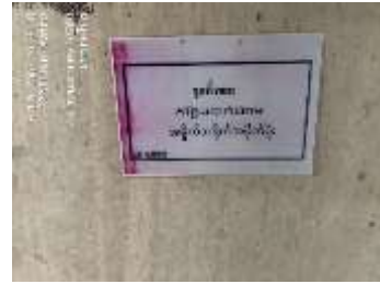
รูปที่ 19 จุดทิ้งขยะ