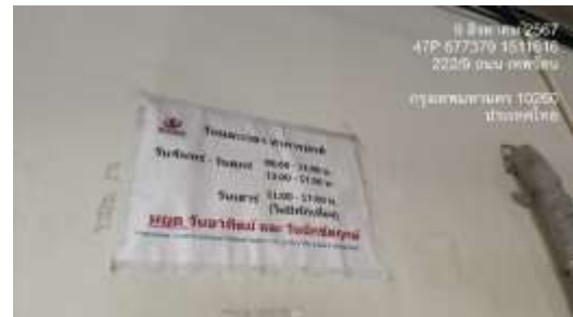
รูปที่ 15 เวลาทำงาน