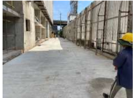
รูปที่ 1 รั้ว Metal Sheet