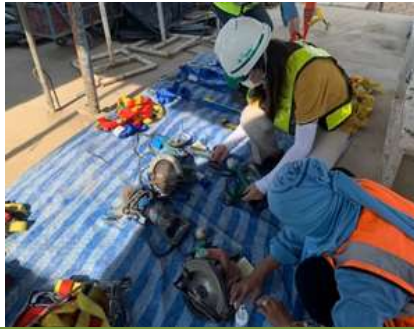
รูปที่ 31 เจ้าหน้าที่ตรวจเช็คเครื่องมือ