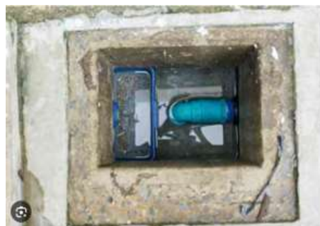
รูปที่ 38 ปอดักตะกอน