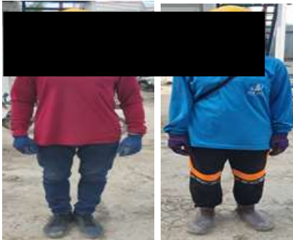
รูปที่ 33 การแต่งตัวของพนักงาน