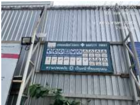
รูปที่ 26 ป้ายแนะนำและเตือนภายในโครงการ