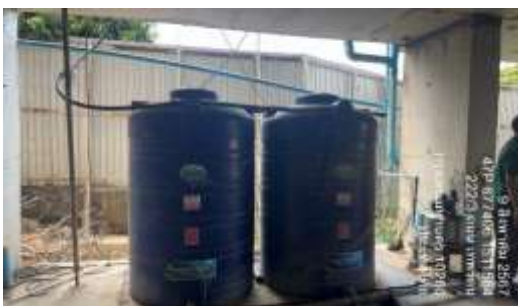
รูปที่ 17 ถังสำรองน้ำ