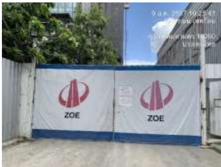
รูปที่ 14 ประตูปิดทึบ