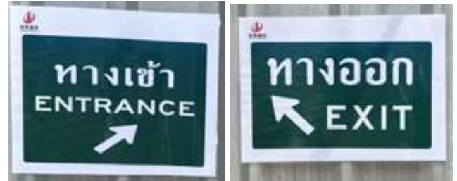
รูปที่ 35 สัญลักษณ์แสดงทางเข้า - ออก