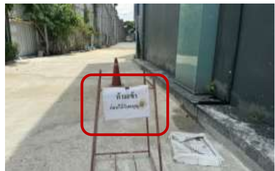
รูปที่ 30 ป้ายห้ามเข้าโครงการ