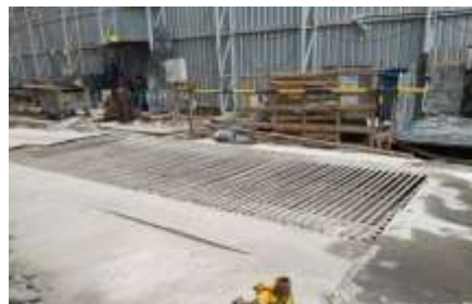
รูปที่ 7 พื้นที่ล้างล้อ