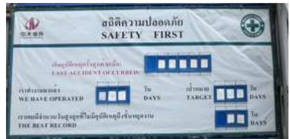
รูปที่ 28 ป้ายแสดงสถิติอุบัติเหตุ