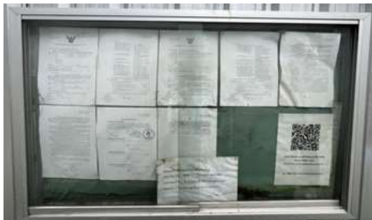
รูปที่ 36 บอร์ดประชาสัมพันธ์