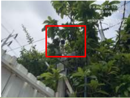
รูปที่ 24 กล้องวงจรปิด