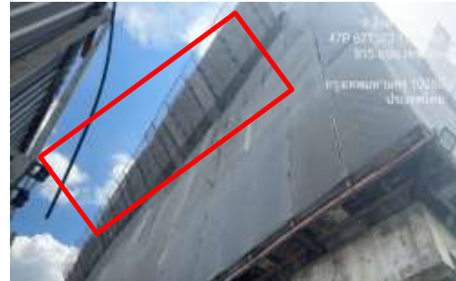
รูปที่ 13 แผงกันวัสดุตกหล่น