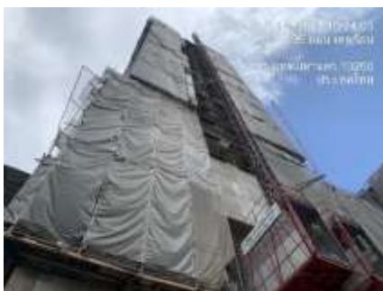
รูปที่ 8 ผ้าใบ (Mesh Sheet)