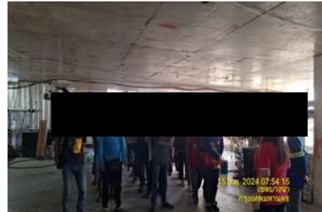
รูปที่ 32 Safety Talk