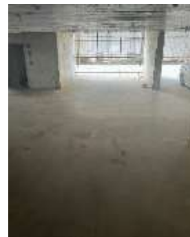
รูปที่ 20 พื้นที่จอดรถ