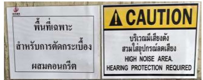
รูปที่ 37 ป้ายเตือนบริเวณพื้นที่เฉพาะ