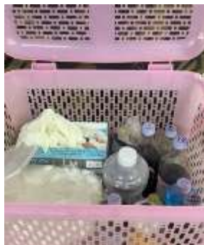
รูปที่ 27 ห้องพยาบาล